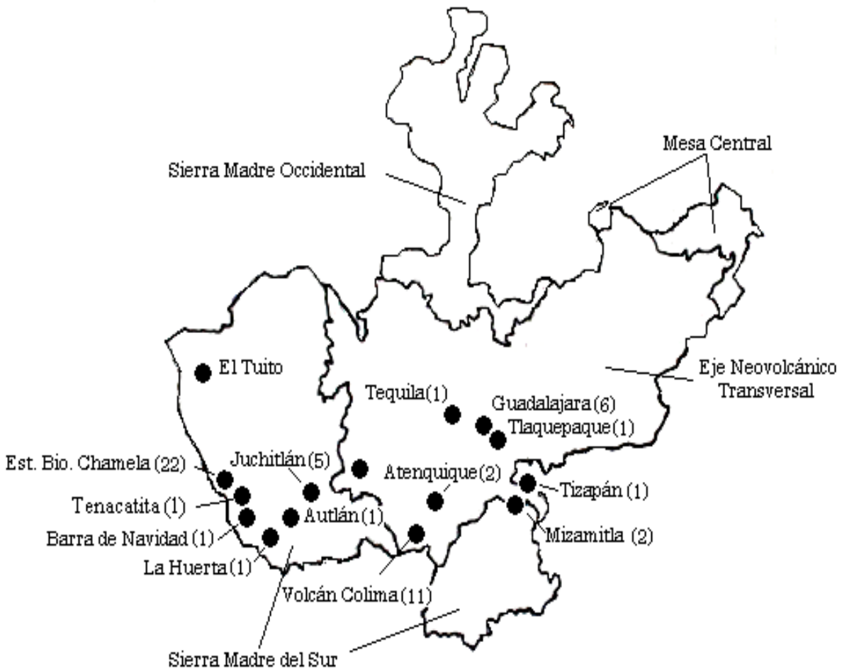
Figura 2. Provincias fisográficas y localidades del estado de Jalisco en donde se han descrito los taxones de estos grupos de escarabajos ambrosiales y descortezadores. Se indica en paréntesis el número de especies descritas de escolítidos de cada localidad. 1) Atenquique 2; 2) Autlán 1; 3) Carr. Barra de Navidad-Puerto Vallarta 1; 4) Estación de Biología Chamela 22; 5) Guadalajara 6; 6) La Huerta 1; 7.- Juchitlán 5; 8) Mazamitla 2; 9) Tequila 1; 10) Tenacatita 1; 11) Tizapán 1; 12) Tlaquepaque (?) 1; 13) El Tuito 1; 14) Volcán Colima 11; 15) Jalisco sin localidad específica 1 (Imagen tomada de INEGI, 1981).

Sin duda, la fauna de estos grupos en Jalisco es mucho más diversa en cuanto al número de especies se refiere, debido a la extensión territorial y los diferentes tipos de vegetación que aún quedan por explorar. Los estudios faunísticos de estos grupos de escarabajos, incrementarán de manera significativa el número de especies para esta región.